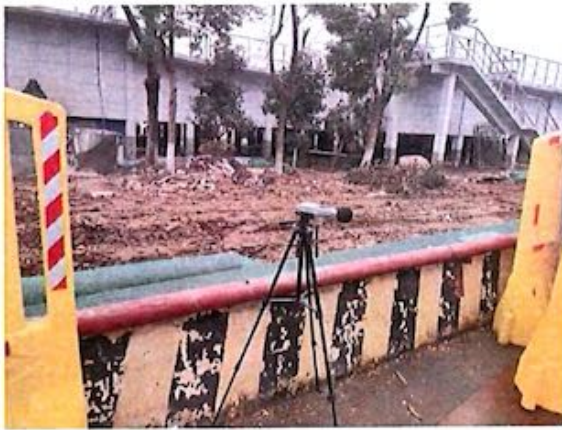
厂界 3# (▲3) 噪声监测