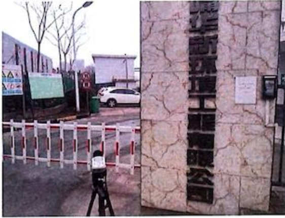
厂界 1# (▲1) 噪声监测