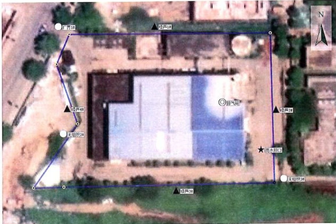
附图 1：监测点位示意图

图 例 ○无组织排放废气监测点位 ◎有组织排放废气监测点位 ▲噪声监测点位 ★废水监测点位