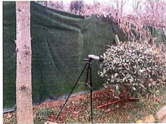
厂界 4# (▲4) 噪声监测