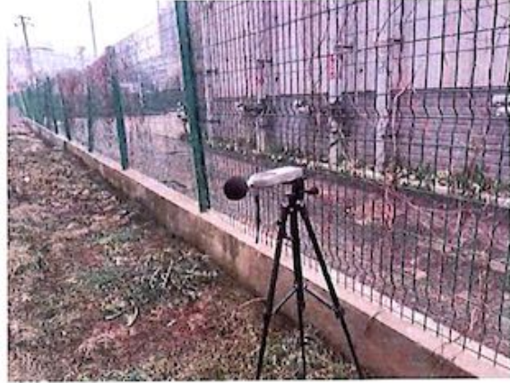
厂界 2# (▲2) 噪声监测