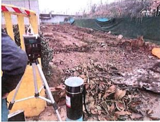
厂界 3#（O3）无组织排放废气监测点