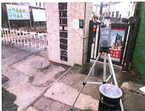
厂界 1# (O1) 无组织排放废气监测点