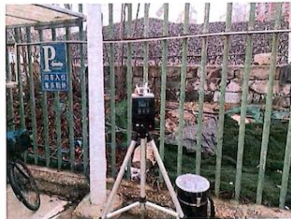
厂界 2# (O2) 无组织排放废气监测点